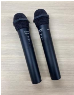
ワイヤレスマイク