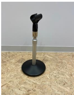
マイクスタンド(卓上型)