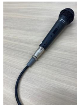
ダイナミックマイク