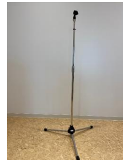
マイクスタンド(床上型)