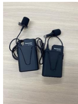
ワイヤレスマイク (タイピン型)