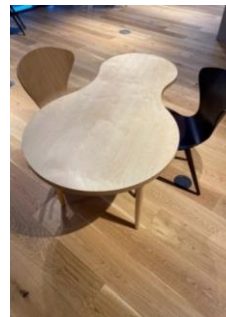
組み合わせテーブル2 2台