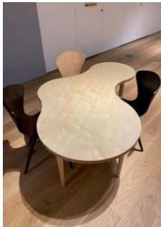
組み合わせテーブル1 2台

ミライエハウス周辺にある閲覧用テーブル及び椅子です。 使用の際は、備品使用計画表をご提出ください。