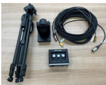
オンライン会議用機材